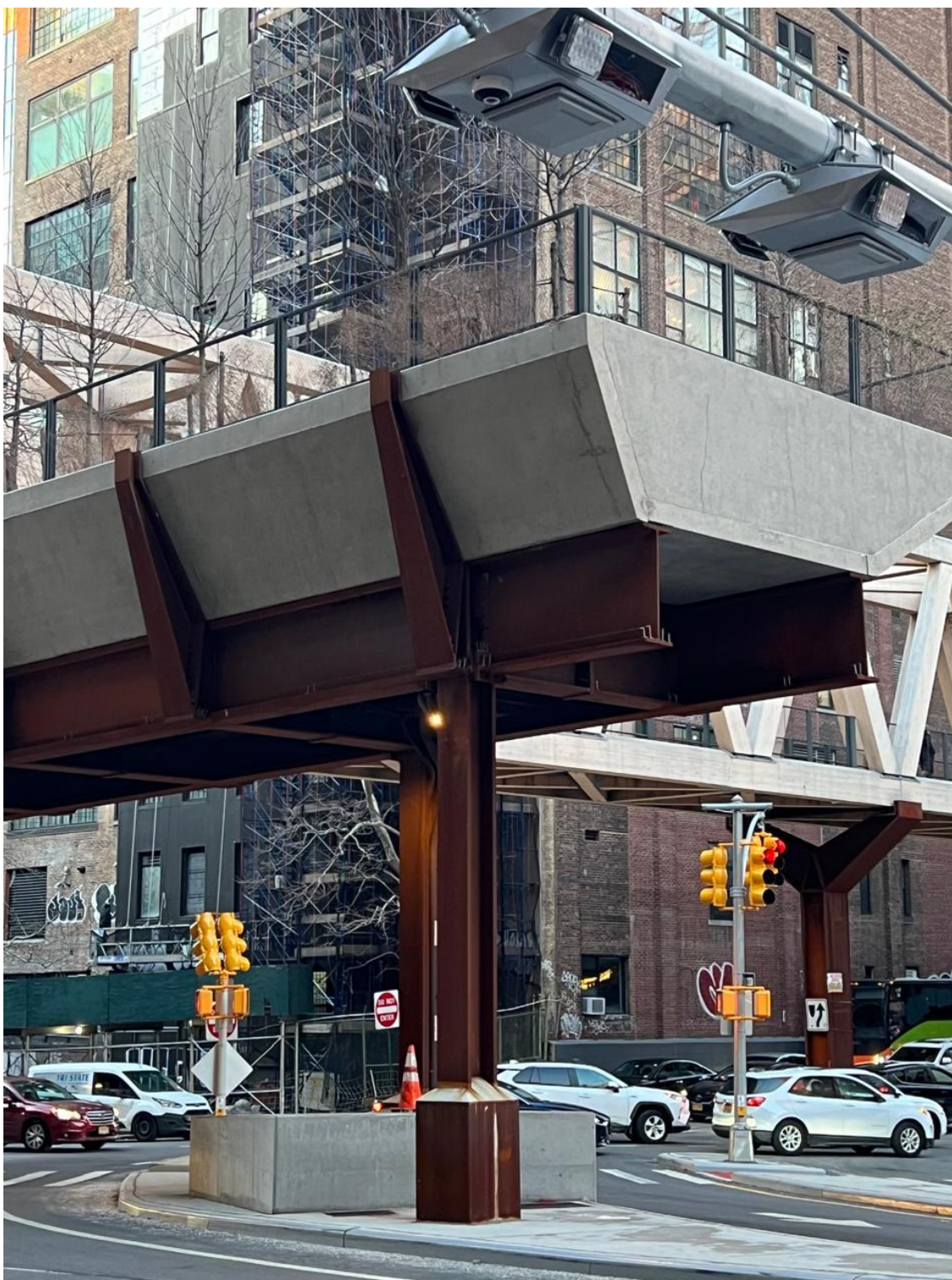
Figura 3: Referência de Ciclovía 03.