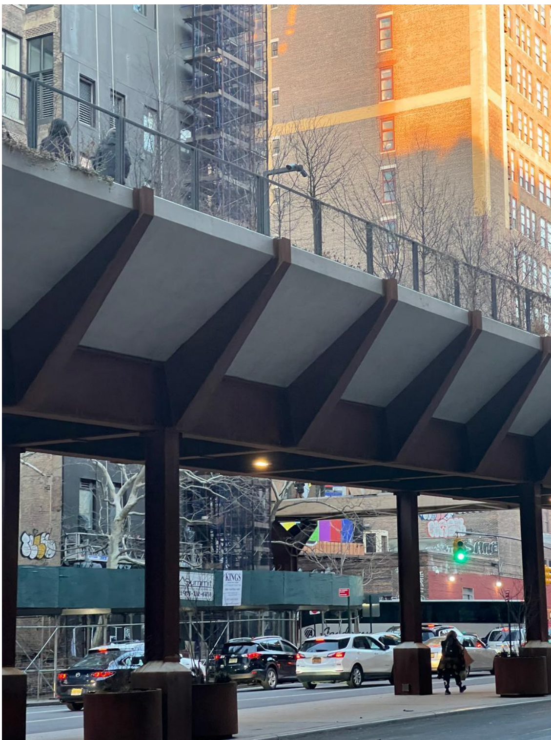
Figura 4: Referência de Ciclovia 04.