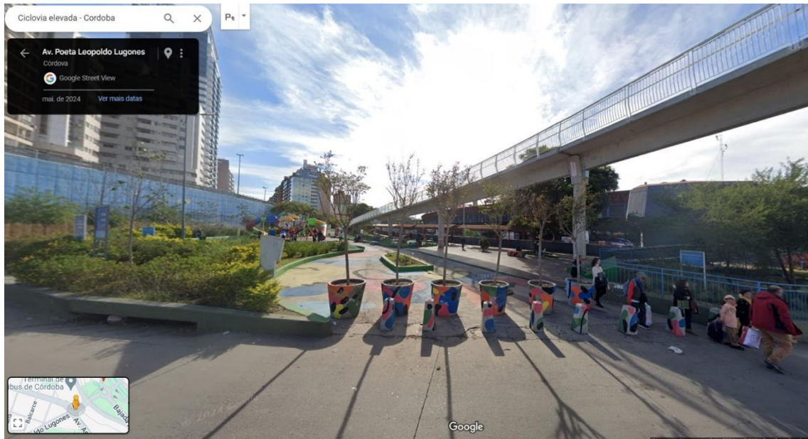
Figura 1: Referência de Ciclovía 01.